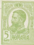
Tabela de taxare

MANDAT POSTAL Pentru suma de Lei ..... bani (A se repeta suma in litere)